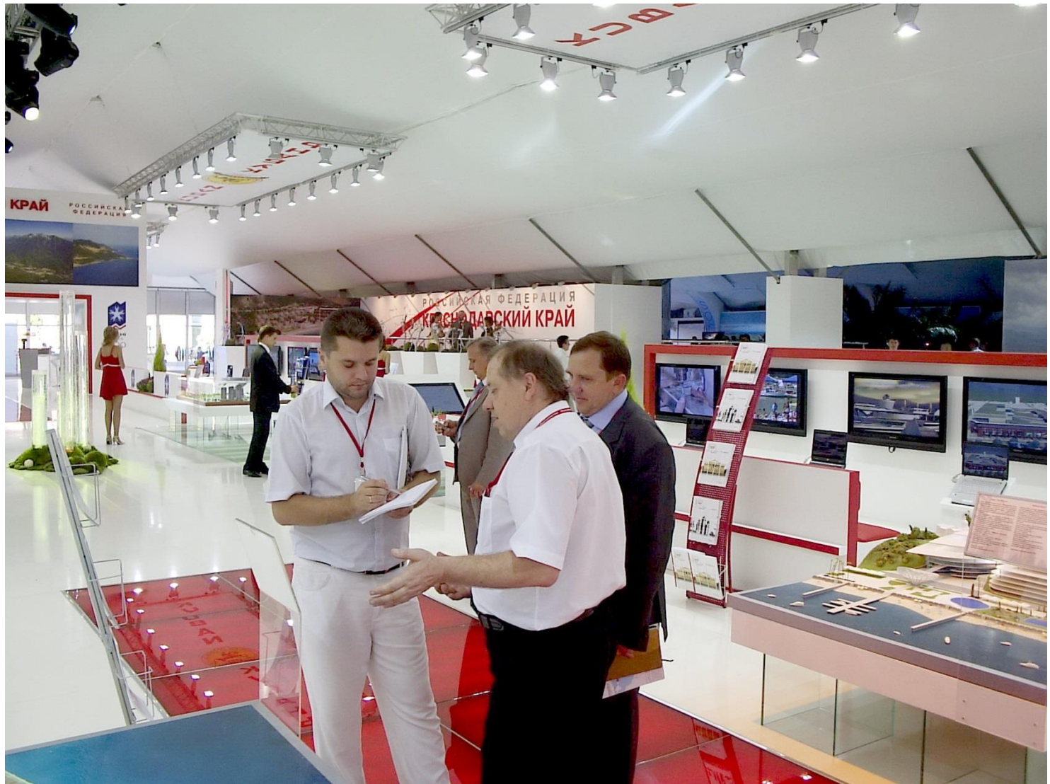
Командировка в г. Сочи на Сочинский международный экономический форум в 2007 г.