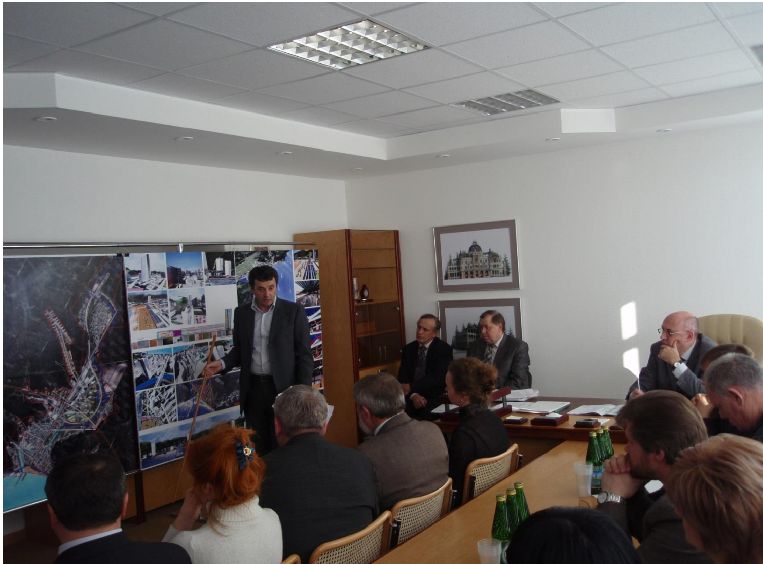
Заседание Градостроительного Совета департамента по архитектуре и градостроительству Краснодарского края 2008 г