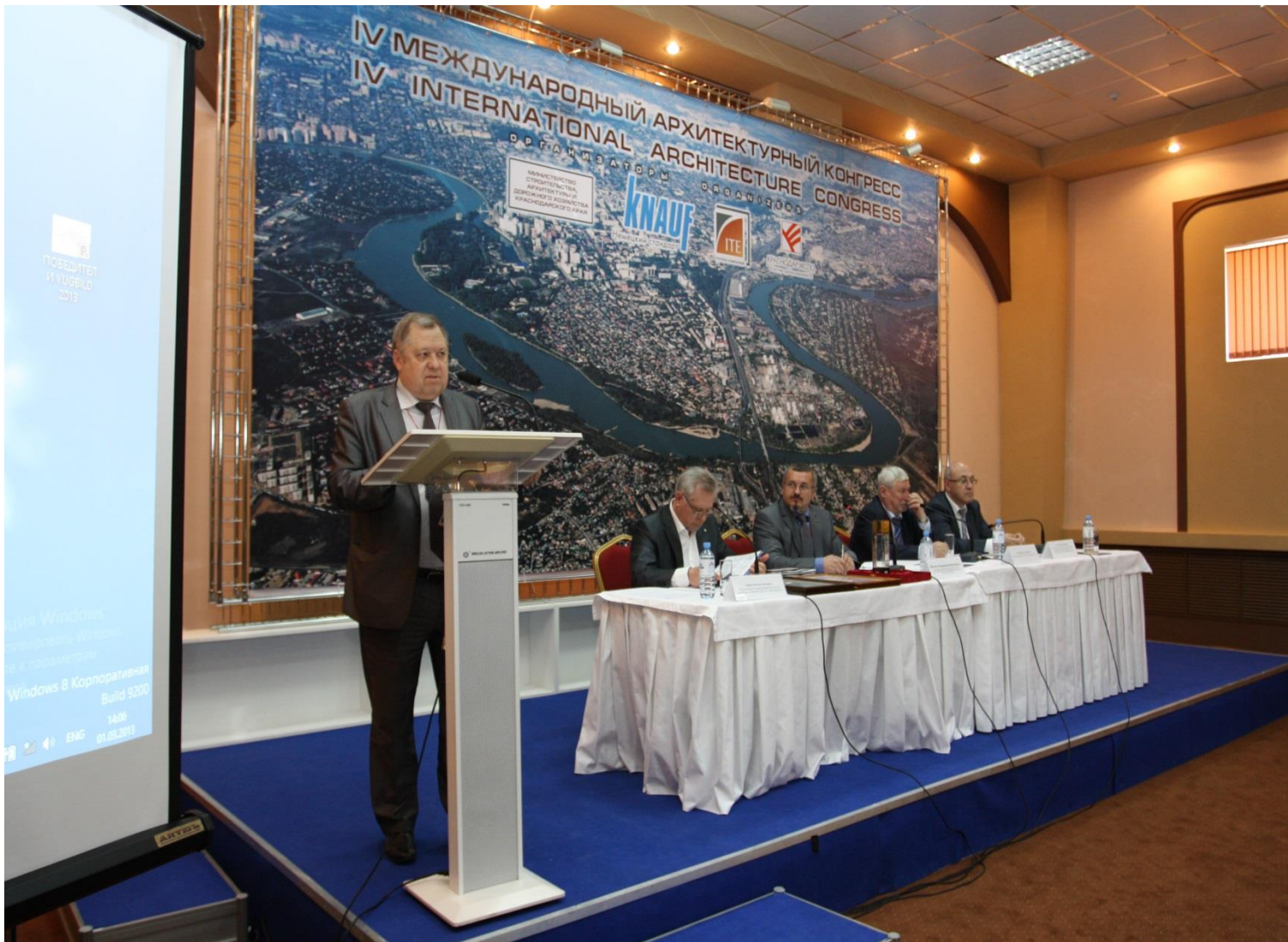
Выступление В.М. Василенко на IV международном архитектурном конгрессе в 2013 году